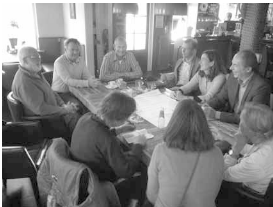
Werkgroep Horizon Schiermonnikoog Delegatie van GDF SUEZ

Tegen de aanvraag voor de proefboring kan men gedurende zes weken bezwaar maken. Dan neemt Economische Zaken een beslissing. Daar is dan weer beroep tegen mogelijk. Ook kijkt een onafhankelijke commissie er nog naar. ■